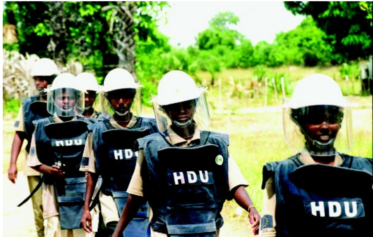
1983 ඇරඹි යුද්ධයෙන් සියලුම ජන කොටස් අතර අභ්‍යන්තර කැලඹීම ඇතිවිය.

සාමූහිකත්වය යනුවෙන්, අප සියලු දෙනා ම දේශපාලනික වශයෙන් එකඟවීමක් හෝ විවිධ රටවල සිටින පුවත්පත් කලාවේදීන් හෝ නොයෙකුත් කණ්ඩායම්වලට අයත් අය, විවිධ පුවත්පත්වලට අයත් අය හෝ ප්‍රතිවාදී වැනල්වලට අයත් අය අතර තරඟකාරී බවක් නො තිබීම හෝ අදහස් නොවේ. සාමූහිකත්වය පදනම්වන්නේ අපගේ වෘත්තීයේ වැදගත්කම පිළිබඳ පොදුවේ එකඟතාවයක් තිබීමත්,