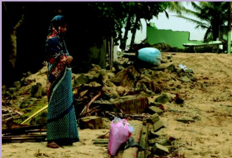
ශ්‍රී ලංකාවේ වැරදිපාල

තවත් වැදගත් කරුණක් නම් වාර්තාකිරීමට ගතවූ කාලය සළකා බැලීමේදී විකාශය කෙරුණු වාර ගණන හා වෙන් කළ කාලය අතර