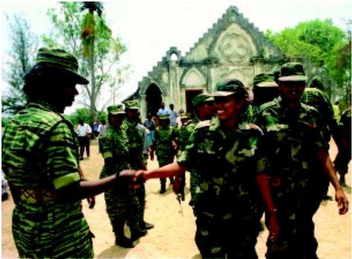
ගැහැණුන් යුද්ධයේ ගොදුරු ය.... නමුත් ඔවුන් සටන්කාරියන් මෙන් ම දෙනසට දෙනසකට කැමති අය ද වේ.

බහු භාෂා බහු ජනවාර්ගික ජන සමාජයක අනිකුත් ජන කොට්ඨාශ වල විශ්වසනීය මූලාශ්‍ර ඉතා වැදගත් වේ. විශිෂ්ට වාර්තාකරුවන්ට පුළුල් වූ විවිධ වූ මූලාශ්‍ර ජාලයක් තිබිය යුතු ය. පුළුල් මූලාශ්‍ර පද්ධතියක් තිබීමේ තවත් වාසියක් නම් තොරතුරුවල නිරවද්‍යතාවය දැනගැනීම සඳහා විකල්ප මගකින් තහවුරු කරගැනීමට හැකි වීම ය. කිසියම් සිද්ධියකදී සත්‍ය වශයෙන් ඒ අවස්ථාවේ එහි සිටි පුද්ගලයින්ගෙන් ලබාගත