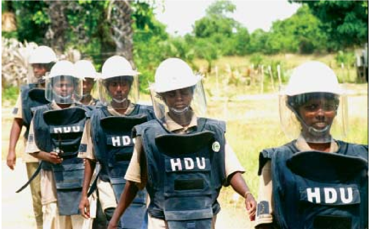
1983 இல் ஆரம்பமான யுத்தத்தினால் அனைத்து இனக்குழுக்களுக்கும்மிடையிலும் உள்விவகார சிக்கல்கள் ஏற்பட்டன.

கூட்டொருமை என்பது நாம் அனைவரும் அரசியல் ரீதியாக இணங்க வேண்டும் என்பதையோ அல்லது பல்வேறு நாடுகளிலுள்ள அல்லது