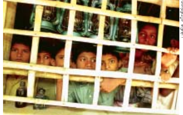
முரண்பாட்டு நிலைமையின் போது பிள்ளைகளை பாதுகாப்பதற்காக ஊடகம் முக்கிய பத்திரத்தினை வகிக்கின்றது

பத்திரிகையாளர்களின் பரந்த இனத்துவ வீச்சினை வேலைக்கமர்த்துதலும், சிறுபான்மை மொழிகளைப் பயன்படுத்துவதும்