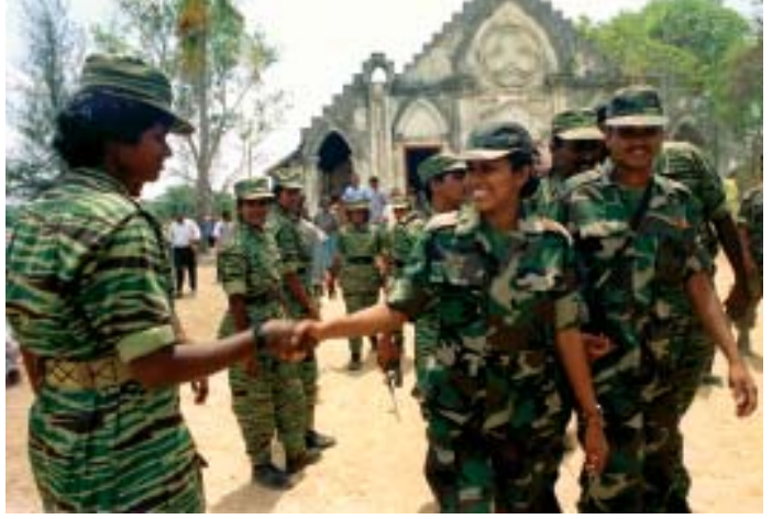
பெண்கள் யுத்தத்தின் இரகசவாளர்கள்..... ஆனால் அவர்கள் போராளிகளைப் போல் வித்தியாசமானவைகளுக்கு விருப்பமுடையவர்கள்.

சிறந்த பத்திரிகையாளர்கள் பல்வகைமை மிகு மூலங்களின் மிகப் பரந்த